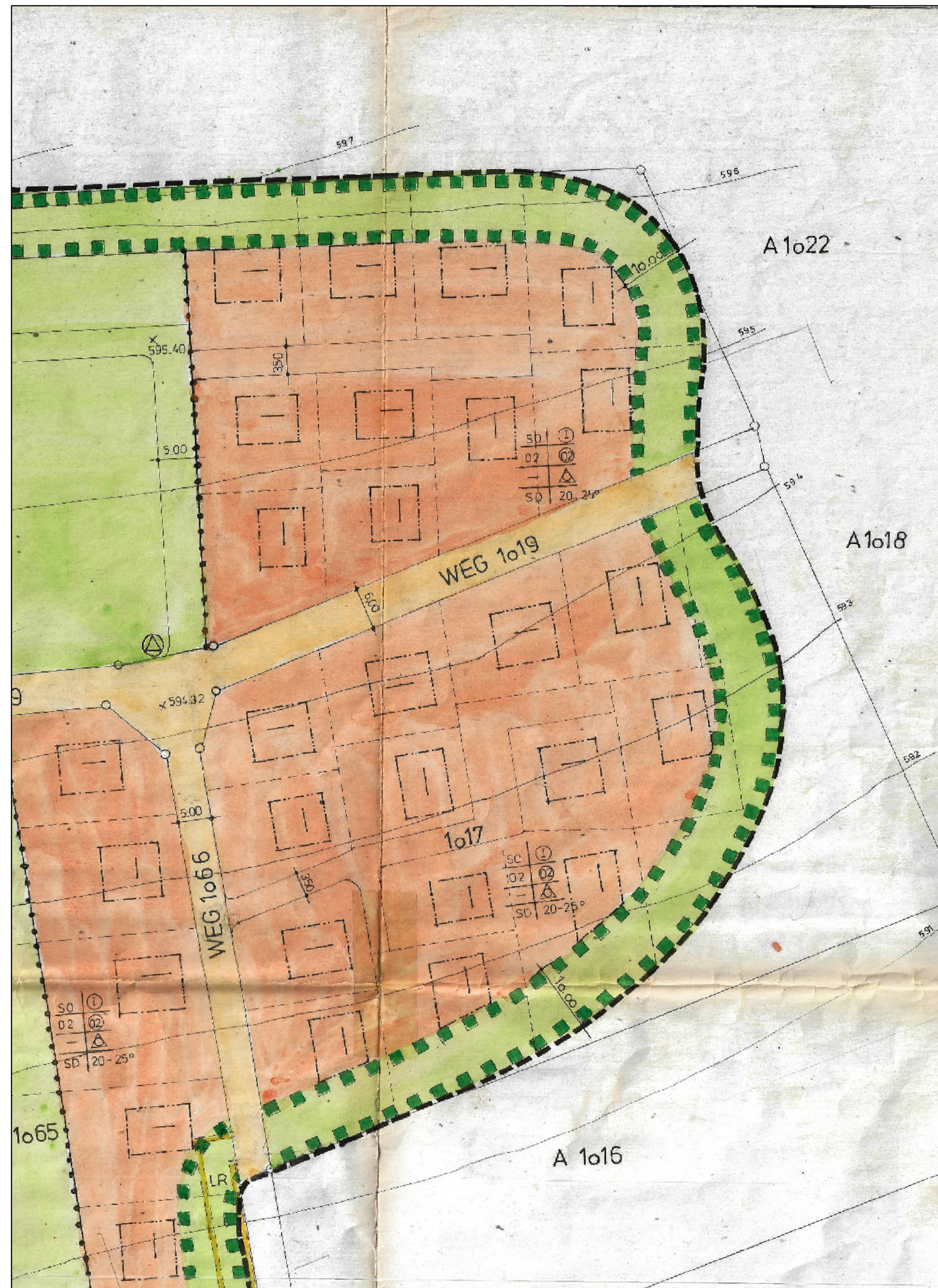
geänderter Bereich des zeichnerischen Teils zum Bebauungsplan "Flugplatz-Härtlesweg", rechtskräftig seit 15.5.1981 (M 1 : 500)