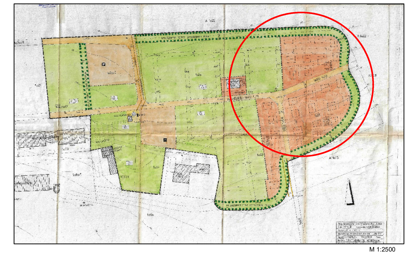
Übersichtsplan zur Änderung

Schriftlicher Teil des Bebauungsplans "Flugplatz-Härtlesweg" Sämtliche textlichen Festsetzungen und örtlichen Bauvorschriften (bauordnungsrechtliche Vorschriften) des Bebauungsplans "Flugplatz-Härtlesweg" - in der Fassung der letzten Änderung rechtskräftig seit 15.5.1981 - bleiben weiterhin in Kraft.